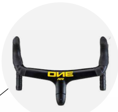
ONE RR FULL CARBON INTEGRATED