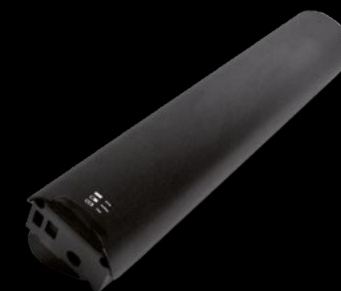
BATTERIA 504 / BATTERY 504