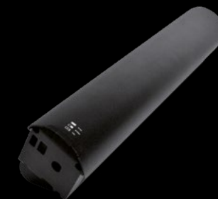
BATTERIA 630 / BATTERY 630