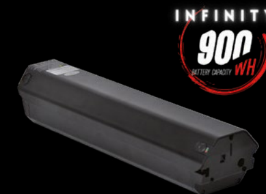
BATTERIA 900 / BATTERY 900